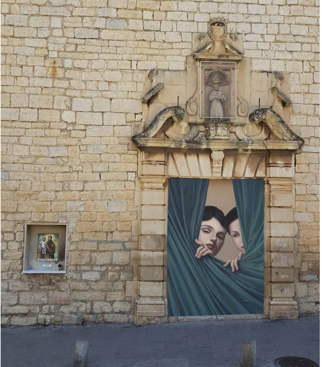
Figura 5. Entrada a la Iglesia de San Antonio, Plaza de los Jardinillos, intervenida por Nati Rodríguez (en el plano número 6).