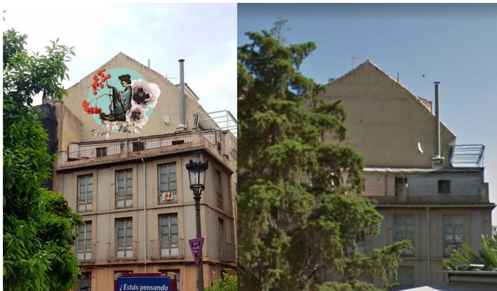
Figura 4. Izq. Medianera de la Plaza del Pósito intervenida digitalmente por Nati Rodríguez (en el plano nº9); drcha. mismo espacio sin intervenir.

Los espacios seleccionados, seguramente no podrían haber sido intervenidos de forma física. Son, desde rincones más escondidos hasta otros mucho más visibles, generalmente del centro histórico, incluso en monumentos de Edad Moderna, y otros contemporáneos, entre los que se destacan algunos como el Museo Íbero, la Estación de Autobuses, el Pilar del Arrabalejo, una esquina de la céntrica y simbólica zona de Reja de la Capilla, el lugar también especialmente significativo de la plaza del Pósito, bajo el cartel de los míticos almacenes del mismo nombre ya desaparecidos, el Mercado de Abastos de Peñamefecit, el entorno de la Catedral, la puerta de la parroquia de San Antonio (edificio histórico del siglo XVIII), entre otros. En general, son rincones y espacios de especial significación para la sociedad giennense, como la Avenida de Andalucía, popularmente conocida como Gran Eje, sobre la antigua tienda de Ivarte, muy popular en la capital (Figuras 4-6).