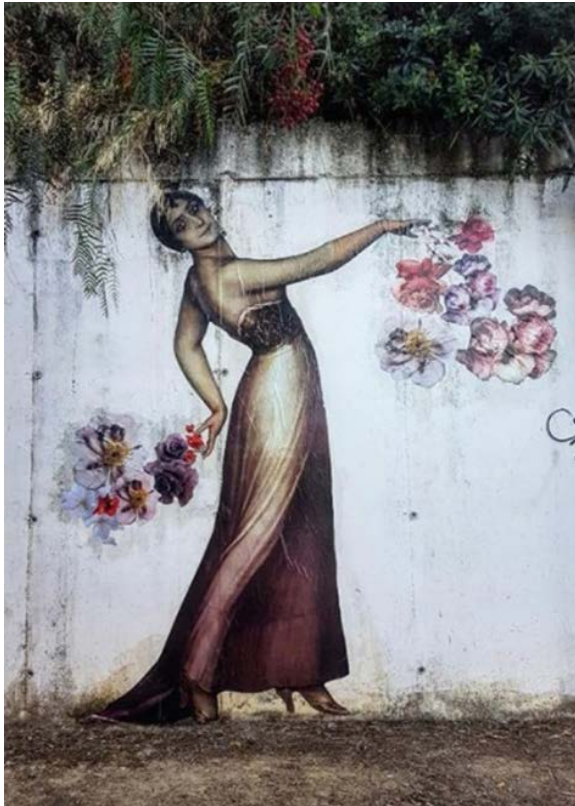
Figura 2. Obra de Nati Rodríguez perteneciente a la serie Femme Collage , 2021.

Este proyecto, que era físico y de arte relacional, se ha transformado en un proyecto virtual e individual de la autora :