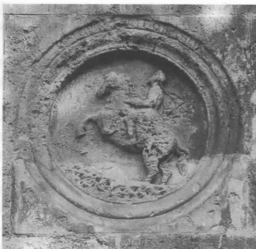
Fig. 2. Alejandro cabalgando sobre Bucéfalo. Tondo del pilar de Carlos V

de proeliis, llegaría a ser entonces la obra más traducida después de la Biblia, sirviendo de fuente a otros poemas narrativos como el Roman de Alexandre y el Alexandreis de Gautier de Châtillon, ambos del siglo XII y referenciales, junto al Pseudo Calístenes, de nuestro Libro de Alexandre .