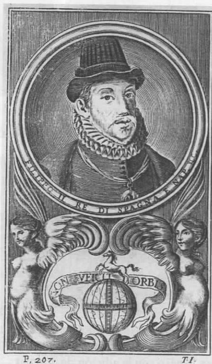
Fig. 7. Felipe II Fuente: PARRINO, 1692: II, 207 (ya en el siglo XVIII, Gerard van Loon la recoge en su Histoire metallique des XVII Provinces des Pays Bas 34