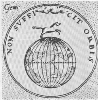
Fig. 4. Divisa de Felipe II

La divisa sería fielmente reproducida en 1601 por Jacobus Typotius 30 .