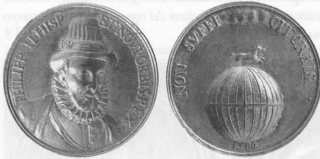
Fig. 3. Medalla de Felipe II como rey de Portugal

en 1580 (Lisboa: Museu Numismático Português) con motivo, ahora sí, de la incorporación de Portugal a la Corona española 29 . En el reverso figura un caballo galopando sobre el globo terráqueo con los meridianos y el ecuador señalados.