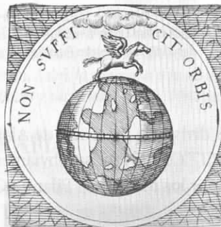
Fig. 5. Divisa de Felipe II Fuente: NEUGEBAUER, 1619: 131

Lo fue también en 1619 por Salomon Neugebauer 31 , si bien convirtiendo al caballo en Pegaso con la adición de dos alas.