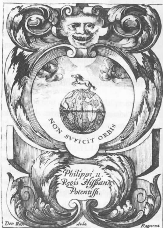
Fig. 6. Divisa de Felipe II Fuente: GÓMEZ DE LA REGUERA, 1990: 209.

Asimismo, con idéntico cuerpo y alma, la divisa aparece en un retrato de Felipe II, grabado anónimo italiano del siglo XVII, publicado en 1692 por Domenico Antonio Parrino en su Teatro eroico, e politico de' governi de' vicere del regno di Napoli dal tempo del re Ferdinando il Cattolico fino al presente 33 .