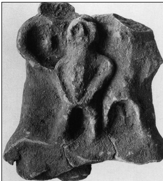
Fig. 9. Conjunto en terracota procedente del santuario de Los Altos del Sotillo (Blech 1993, lám. 56b).

¿Qué significado tiene la presencia de las escasas ofrendas en terracota? La exigua iconografía de estas figurillas no evidencia rasgos definitorios que permi-