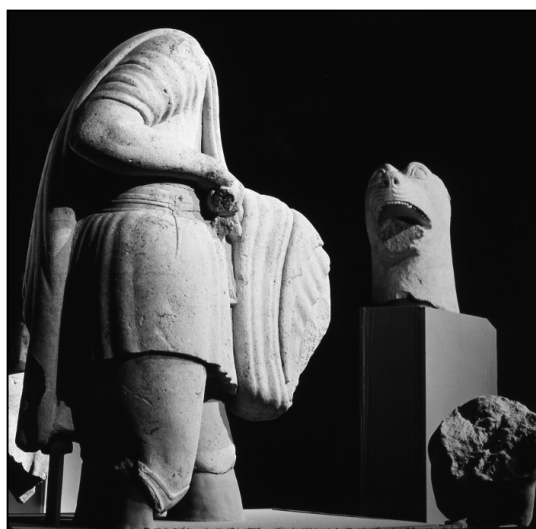
Fig. 4. Detalle del enfrentamiento heroico de El Pajarillo (Museo Provincial de Jaén).

El escenario del santuario de El Pajarillo viene a destacar, con la presencia de los grifos, la existencia de un tiempo mítico que conviene retomar aquí, porque no solamente está expresado a través de la escena que describe la escultura, sino que la torre, que