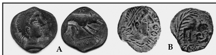
Fig. 6. Emisiones de Iltiraka , mediados del siglo II a.n.e. (CNH 356.1 y CNH 356.2) en García-Bellido, M.P. y Blázquez, C., 2001: 186.